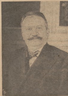
P. Gaston Doumergue. Przewodniczącym Kongresu, pod przewodnictwem którego odbył się Zlot w Strasburgu.

(Extrait du discours de M. Gaston Doumergue, président du Sénat, député président de la République, au Banquet du Cinquantenaire de l'Union des Sociétés de Gymnastique de France, le 4 novembre 1923.)