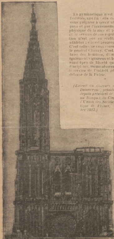
Katedra w Strasburgu. Aluzacja.