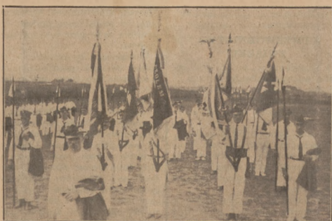
Sztandary gniazd na zlocie Okr. IX

2) NARZĘDZIA ODDYCHOWE. Prawidłowo oddychanie gra wielką