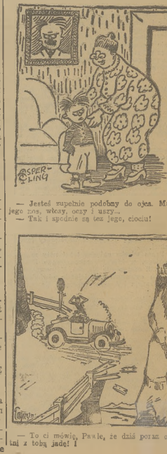
— To ci mówię, Pawle, że dziś poran ciecia mi i toh ja się!

Geolodzy i astronomowie obliczali wiek ziemi na podstawie różnych metod. Uczący Francuzi, Paul Coudera, twierdził, iż wiek ziemi wynosi około 2 miliardy lat, od czasu, gdy powstała ona zwarsta, szlak skorpore imi uczelnia, operując się na wznikach badań zaidoktych, wyznaczył wiek ziemi na około 3,5 miliardy lat. Według wiek przyjętych obecnie poglądów w kołach uczonych, ziemia nasza, jako ciała niebieskiego, stała, być od 2 do 3 miliardów lat.