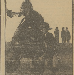
— O, gdybym mógł stać się tego gościa, który zamienił mi kapelusz. — I ja również. Mógł być osobie nieowy!