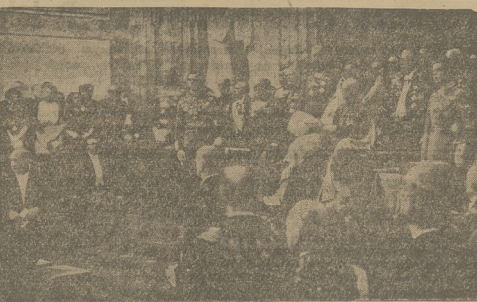
OTWARCIE PARLAMENTU SZWEDZKIEGO

Francja jest bogata i może sobie poradzić na różne alternatywy, których nie ograniczy państwowa nie zmoczyli. Ale oczywiście i jej musi ostatecznie fatalna gospodarka skrzyknąć lewicę. Bez zważenia a komunistami nie może nastąpić zwrot ten leparum.