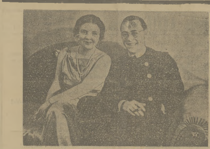
CAŁA HOLANDIA OCZEKIJE PRZYSZŁEGO DZIEDZICA KORONY Czł. Holandia żyje w gorączkowym oczekiwaniu na narodowy potomek następujący tron holenderski. Na zdjęciu kr. Józef wraz z żoną i małżonkami ksi. Bernarrem.