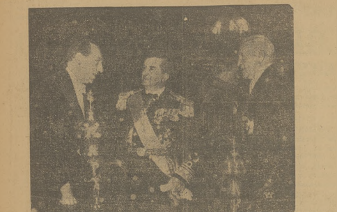
Regent Horthy w rozmowie z ministrem spraw zagranicznych Bókaiem. Na prawo P. Prezydent Republiki.