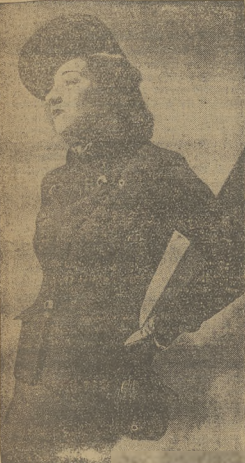
NA SPACER Premiowany w Paryżu kostium spacerowy z belgijskim i miankami, ręczny roboty wy-kształca kobiecego z tura nielubiego.