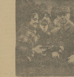
ŚWIĘTO B. FRANCUSKIEJ DWIWIKI ALPEJSKIEJ