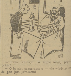
— Panie starszy! W zupie mojej piły? — — Nie, panie! — — O baranie programem — nie wiedział — — O baranie jest jasno!