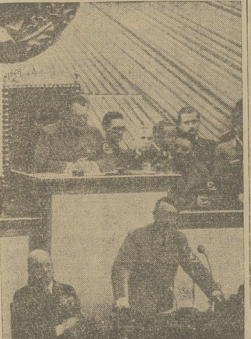
Widownia wyjeżdżająca z opery Krolla

Jako główne elementy poprawy stanu fi- ... nansowego Polski w tym roku wskazuje na ... plany wojny — kredyty frankowe, dalej ... — zgodność do Hiszpanii naprzem, wresz- ... cnie a półmiej panowanie w such stwie ... wahałki, które zagrzęzła mowa. Przeskoki ... samowolne, trwały do końca wojny i