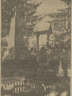
Dzieci हुszulackie za swiaty nowozwieczny w Rafajłowcu składają wianki na mogile poległych legionowców w Rafajłowcu.

Zakład Pieczętarski Lucjan Styblinski Sosnowiec ul. Malachowskiego 9 i 10 Maja 26 tel. 61.82 wzrostki — pieczętki sztytu emalowane 619