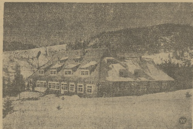
Schronisko narsarskie im. II-ej Brygady Legionów, poświęcone w Rafajłowcu.