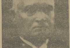
PREZYDENT REPUBLIKI ESTONSKIEJ PAIST

w dniu 24 lutego obchodzi święto narodowe z okazji odzyskania niepodległości. Panowanie rosyjskie w Estonii trwało bowiem aż do wybuchu rewolucji w Rosji, aż w dniu 24 lutego 1918 r., a więc, przed 20 laty, odbyła się uroczysta proklamacja Republiki Estońskiej.