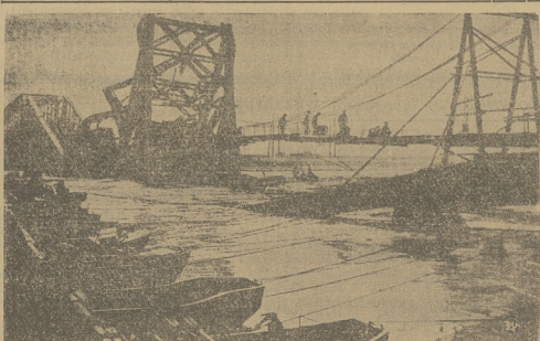
NASTĘPSTWA WOJNY CHINSKO-JAPANEJSKIEJ Na zdjęciu fragment z prac przy odbudowie obciążonego mostu żelazkowego na rzecze Żółtej w Chinach, zmniejszone całkowicie w wyniku działań wojennych chińsko-japońskich.