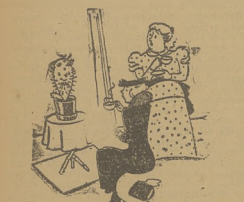
— Z tym kapciusem nie mogłabym iść, nie zostawił! Przygnasim na niego męła nie bezczynie, gdy nie był ogolony!

„ORZEŁ” — Parada w Flandrii — (z Greta Garbo).