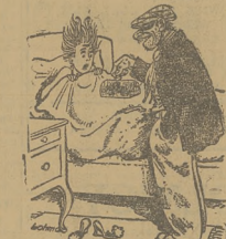
— Proszę powiedzieć gdzie są pomieszczenia, bo inaczej przysiężę mi!

— Członk ostrożny siedział trzy miesiące w więzieniu. — Bo nie chcieli mieć wstępnego wygnania.