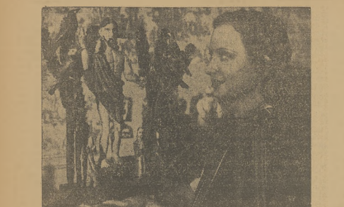
WYSTAWA POLSKIEJ SZUKI LUDOWEJ W PARYŻU