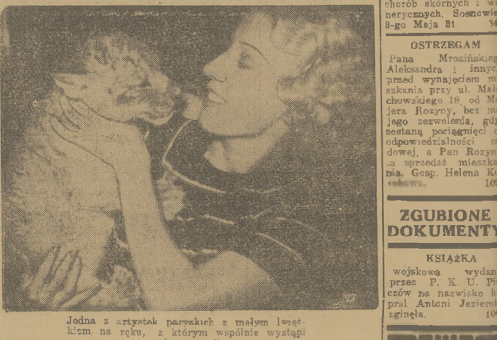
Jedna z artystek parowych z moym west-kim na ręk, z którym wspaniały wystąpił podczas rewii.

Przeł. I wstąpił 11.30 w niedzielę o g. 15.30