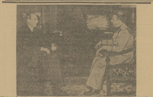
Minister Beck i wioad minister spraw zagranicznych hr. Ciano, podczas konferencji w Pa- łacu Ostrej w Rzymie.

Z tego widok, komu należą na utrzy- maniu ogóły i bezrobocia. Zorganizowa- nym w szereгах OZN świat pracy — wypowiada zdecydowaną walkę zająk- no psychologicznie i bezrobocia, jak i knowaniem wytworowców.