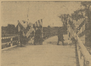
Symboliczne otwarcie bramy granicznej na granicy polsko-litewskiej, na moście, na rzecze Mewe czarna.