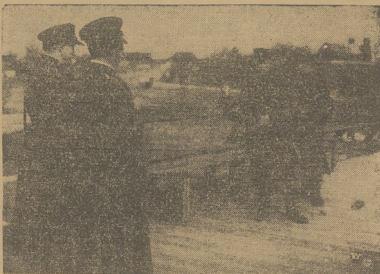
Pierwsze od wielu lat spotkanie celników K. O. P. z litewską strażą graniczną w pade przy granicy.

Pogodzenie Orla z F. gorą — to zdanie donioślejsze dla nas niż proste uregulowanie sąsiedzkich stosunków z krajem, znajdującym się za naszą północno-wschodnią granicą. Donioślejsze nie z punktu widzenia interesów materialnych państwa, szerszy bowiem krąg zagadnień patronował nam przy zawieraniu paktów z Anglią i z Sowiekami, a potem z Niemcami, lub przy zawieraniu sojuszu z Rumunią. Ale donioślejsze z perspektywy historii Polski i jej interesów duchowych.