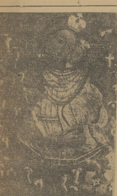
W związku ze zbliżającym się terminem kampanji milionarza polskiego b. Andrzeja Boboli, rozpoczynającej się przedwiośnie, w szczyt Marksi Boboli, kazierny Piłsudski, przed letowym moście si b. Andrzeja Boboli i krócy to obra według legendy, to-dowej, miał być namalowany przez b. Bobolę...