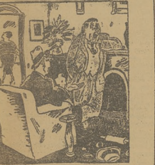
Właściwie wypracować powiadomienie, kto jest najlepszym czytelnikiem i dziennikarzem.

W ub. niedzielę odbył się na Placówce mecz polskiński między zespołami Placówka a KS