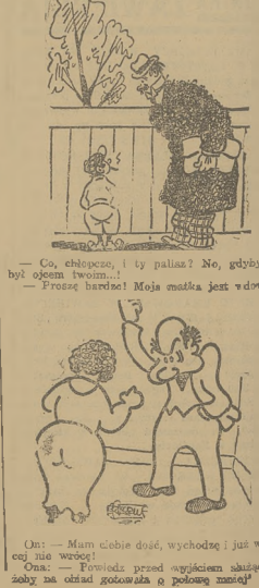
— Co, chłopco, i ty palasz? No, gdybym był ojcem twoim... — Proszę bardzo! Moja matka jest wdową!