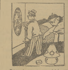
— Piłsudski się pana po raz ostatni, czego wstawca szuka pan w polojno jego mojej?