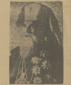
Patriarcha i premier Rumunii de Miron Cristea. przybył wczoraj do Warszawy

DZIEŃ SOLIDARNOŚCI Z POWSTAŃCAMI RZYM, 20.5. (tel. wł.) 29 m. będzie