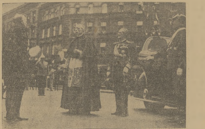
ŚWIATOWY KONGRES BUCHARYSTYGINY W BUDAPESTIE

W samce przedostatnioma pomasł 400 oficerów i podchorążych rezerwy, wykonując znakomita postawę. Tłumy lwowskią gorąco oddawać maszerując kolumny, obejmując je lewiatanami. Po zakończeniu defilady, Marszałek Śmigły Rydz wraz ze świtą do Teatru Wielkiego, gdzie odbyło się otwarcie Zjazdu Oficerów Rezerwy.