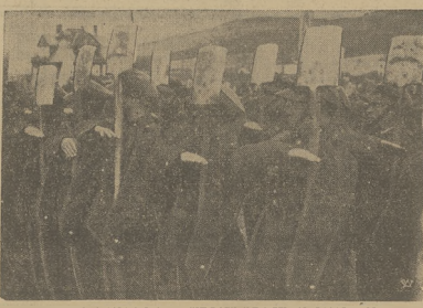
SWIETO JUNAICKICH HUFÓW PRACY W ZAKOPIANEM

W Zakopanem odbyło się w obecności milicjanta spraw wojłkowych gen. Kasprzyckiego święto junaickich hufców pracy. Na sekcji stanął zastępca przewodniczącego prezydium gen. Kasprzyckiego.