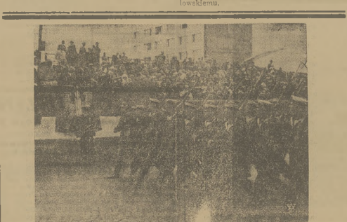
Fragment z defilady oddziałów polskiej marynarki wojennej, która przejeżdżał p. wicepremier katowicki w czasie ke. biskupa muzuł. Okręgowego, przedstawicieli administracji, oraz reprezentacji władz w woj. Rzeziwiec i kom. Naczel. Szkiełom na czele

Justo oprócz meczu BKS Ziębka — Unia Tarczyn z Łodzi o wejscie do ligi, który rozegrano w zeszłym w Dąbrowie o godz. 17.30 odbędą się następujące mecze: