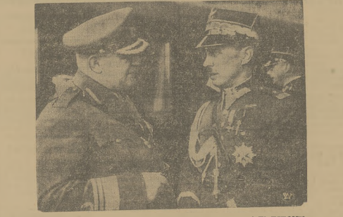
SZEF SZTABU GŁÓWNEGO GEN. STACHIEWICZ W ESTONII Szef sztabu głównego gen. Stachiewicz bawił z wzięcia w Estonii. Na zdjęciu gen. Stachiewicz w rozmowie z gen. Reiksem na dworcu.