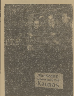
Dalnicznicy jadący do Kowna w ołnie wagonu. Pierwszy z prawej — autor artykułu.