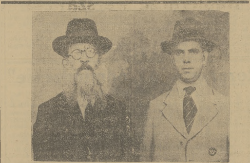
WIELKI KABIN BROOKLYNU — PRZEMYSLNIKIEM NARKOTYKOW

W ub. środę wybuchł pożar w ul. Łońcinacze pod Zawierciem. Pożar strawił dwa domy mieszkalne. Ogień ugasili miejarska straż pożarna z Zawiercia i miejarska z Łońca. Przyczyna pożaru nieustalona.