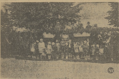
PRZED ŚWIĘTEM NAJSTARSZEGO PUŁKU PIECHOTY LEGIONOW Z WILNIE W dniach od 8 do 8 sierpnia p. b. obchodzi się w Wilnie święto najstarszego legionowego pułku piechoty Złotego przedstawił Marszałka Józefa Pilsudskiego na świecie pułkowym w roku 1932.