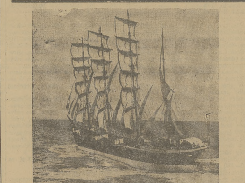
DRAMAT NA MORZU. Pięćci czterostopniowy statek flety „Admiral Karpentier”, który utrzymał komunikację z Australią, spotkał w dnach najbliższych niszczyciela, który zginął okr., wobec braku widności w ciągu 20 dni.