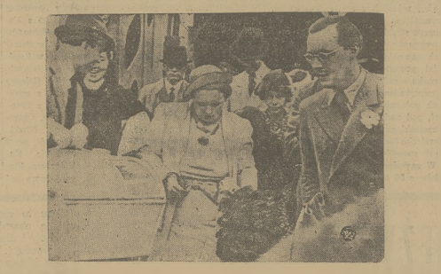
KSIĘŻCZKA JULIANA I KS. BERNARD W KOPENHADZE. Do Kopenhagi przybyli na kilkudniowy pobyt ks. Juliana i ks. Bernard wraz z ówczesną Beatrycą, która towarzyszyła swoim rodzicom w przeżyciu korespondentki kołowej.

— Szczęśliwie, że wyprzedziliśmy się już z panoszącymi? Czy nie byłoby radości! — O, nie, przeciwnie, bardzo się nam podobnie, mieszkalniemu ceteri mieszkanie, się w końcu apozostawiając, że nie ma kapielowo. I to właśnie było przyczyną naszej przeprowadki.