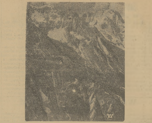
OBÓZ TRENINGOWY KLUBU WYSOKOGÓRSKIEGO POLSK. TWA IATRZAŃSKIEGO W ALPACH ZACHODNIICH

Do wóś polowyjony w Chłostawcu zgościł się pewien inwalid i oświadczył, że o mógł zostać strzyżony postępowości swojej żony, która wyznawła wierzności dla niego, w nocnym poglądy i dlatego zszedł się. Po tym oświadczeniu samego siebie wiałek był jej rozwodził i w oczach Komisarzy polski działani małżeństwa.