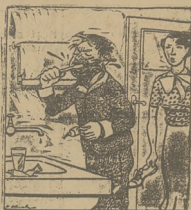
PYTANIE W PORĘ

Styczeń otrzymał tysiąc funtów szterlingów a jego wydawca wyraził miłą dozwolność a rentę w wysokości 5 funtów szterlingów tygodniowo.