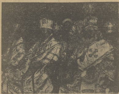
INTRONIZACJA PATRIARCHE SERBSKIEGO KOŚCIOŁA BRAWOSŁAWNEGO Na zdjęciu patriarcha dr Gavriło w otoczeniu biskupów podczas ceremonii intronizacji