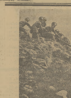
WOJSKA NA MANEWRACH Fragm. z wielkich manewrów francuskich w Alpach. Oświetlenie górskie artylerii.

Jeszcze przed dziesięciu laty, gdy Lindbergh przeleciał Atlantyk w ciągu 33 godzin, uważano to za niezwykły rekord. Dzisiaj wystarczy ponad trzy doby, aby opasać cały świat — lotem maszynami lotniczymi.