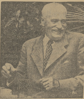
OSTATNIE ZDROBIE P. PREZYDENTA RZECZYPOSPOLITEJ Z LAURANY W ITALII

Poza tym komisja udzieliła niektórym właścicielom upomnień, a m. in. i Hucie Bankowej, której dom przy ul. Żeromskiego pozostawiając pod względem stanu sanitarnego wiele do życzenia.