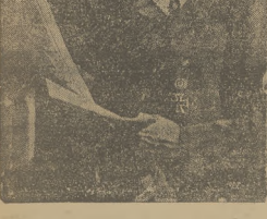
MANEWRY NIEMIECKIE Na zdjęciu naczelny wódz wojsk Rzeszy Nie mieckiej kanclerz Hitler studiujecie plan taktyczny manewrow.