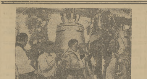
UROCZYSTA KONSEKRACJA DZWONÓW KOŚCIELNYCH W TROKACH

ścieli „Starej Sosnowiczanki” może dobrać słusznych pretensyj z tytułu poniesionych strat, spowodowanych nieuczciwą konkurencją.