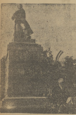
POMNIK KU CZCI BOHATERÓW LUTOWSKICH