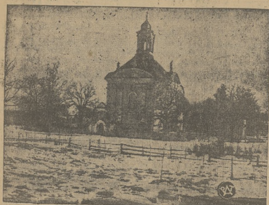
GRUBOWICZ OSTATNIEGO KRÓLA POLSKIEGO

Na zdjęciu rzeźbiony kościół w Wokietrze, w którego kryptie spoczywa truch Starego Augusta Pomostowskiego, sprowadzone z Moskwy.