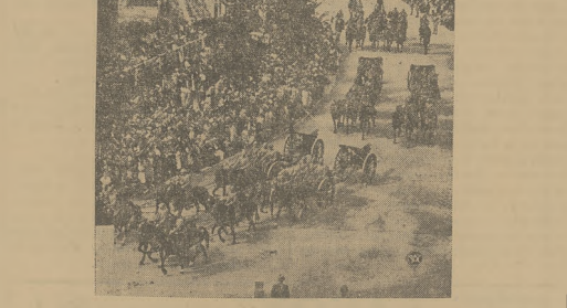
JUBILEUSZ KROLOWEJ HOLENDERSKIEJ

Wielki, koronki, tafy, koronki i jedwab, guzik, przety — to wszystkie spytają się na co drugim modelu. Naogół dżinsy remiennicze wchodzi, a w pierwszym są dnie chłdkie. Kimonowe fasony rękawów, kani czyki mandarynów, male kamizelki z chłdskimi kolekcjami. Władze iasni wyznajaciel staj Parzy — komb nowas zresztą z chłdziejami. Oprócz sterczów rękawów wchodzących spytaki się dnie walców przybrania z wysokiemi manki etami, lub poszerzone szmaragdowe w górze. Do hurtowni nie są zapęta z przedu kamizelki sportowe. Do bursz dżinsowych kamizelki są pod kolor kostiumu lub pizsów. Haftowane, ozdobne „wuchodni” kamizelki nosi są nawet do sukienki podobnych wyrobów zamiast bolarko. Góline