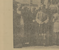
KONSEKRACJA NOWEGO BISKUPA ORDYNARIUSZA DIECEZJI KIELECKIEJ

W katolicy diecezjalny odbył się, jak już p