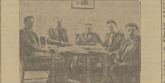
REPREZENTACJI NIEMCÓW SUDECKICH