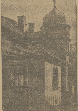
Deon w Jabłonkowie, w którym mieszkał Marszałek Polanski w 1914 roku, kwatery jego i Łę Brygady Legijonu Polskiego.

Na cha te pytania premier udzielił wspaniałe odpowiedzi, oświadczając: „Jakoż w ramach rządu polskiego, domagał się za natychmiastowego odstąpienia terytorium, metaż doręczony rządowi czeskiemu dopiero przed wieczorem 30 września. Zamiar rzędu polskiego zajęcia terytorium czeskiego, nie był przedto znany i nie mógł być omawiany przez przedstawicieli czterech mocarstw w Monachium 29 września”.