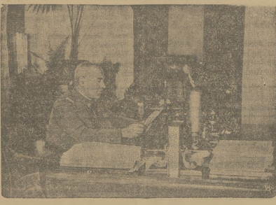
Marszałek Świąty-Lydz wygłasza przemówienie przez mikro, w którym skierował pod adresem całego społeczeństwa słowa podziękowania za tysiące depesz i listów do Niego skierowanych podczas przesłuchanych dni Polku dnia, w których Polska dotkliwie wybitna, niezgody walczyła z zbrodniarstwem.

Czy jesteś na liście wyborców do Sejmu i Senatu? Sprawdź w czasie od 6 do 13 października w swoim obwodzie głosowania