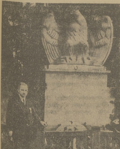
Formaciści odd. Legionistów Polskich w Jarosławcu, zafotograf. jak wiadomo, przez wojska polskie.

Biurowi Komitetu Komitetu Wyborczego mieści się w Będzinie przy ulicy Czarny 5. Godzinny urząd wama codziennie od 9 do 12.