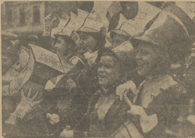
Na twymach dzwignią polskiego. Rezydentami mają się znieść i zmęczyć na rękach inżynierów zolnierz polskich.