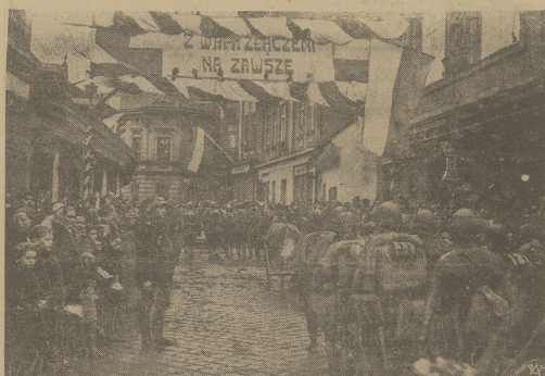
Wierzenie wojsk polskich wśród entuzjazmu ludności na rynek fryztański.

Dla Polski — wolno sądzić — obie drogi są równe dobre, gdyż wysunęliśmy ty żądania oparte na podstawach ściśle etnograficznych i wynik plebiscytu nie daje pola do jakikolwiek wątpliwości. Z drugiej strony jest rzecz jasną, że w razie przynajmniej jak najszerszego załatwienia kwestii terytorialnych i ustalenia nowych granic Czechosłowacji.