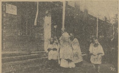
SZKOŁA POWSZECHNA — JAKO WYRAZ WDZIĘCZNOŚCI DLA K. O. P. Na krzesła wleżących w Urnach wyborczych, przepięknie ozdobionych Kuchniai Kuchniarzy, wspaniałymi wykładami, wykazującymi, jakiegoś rodzaju Kuchniarzy, Kuchniarzy, Kuchniarzy. Na zdjęciu można zobaczyć uczniów Szkoły w Urnach.