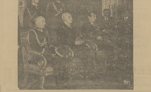
Na Zamku Krakowianin w Warszawie odbyła się, jak już donosiliśmy, uroczystość promocji Pana Prezydenta Rzeczypospolitej prof. dr Ignacego Modzelewo, Marszałka Polski Eduarda Smigły-Rydzia i p. ministra spraw zagranicznych Josefa Becka...