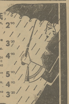
Katowice, sw. Jona 1, — Chorzów, Wolności 18, — Sosnowiec, 3-go Maja 23

Miekie kalosze z językiem, 2 20 cena reklamowa Popularne z tryk. podsz. 3 20 Do getrów 3 30 Damskie gęszczowce wycięte „Model 1938” 3 30 Deszczowce czarne i brzołk. z kłami 3 50 „Ułanki” wysokie buty gumowe lak. w 23-26 w. 27-30 5 90 w. 31-34 6 90 w. 35-38 7 90 Miekie wysokie buty gum. raki. 8 90 „K nadyki” miekie buciki gumowe do sznurowania 5 00 Dziecięce śniegowce rypsowe białe, beige i popielite w. 1-7 3 00 Damskie ciepłe pantofle domowe na filcowej i skór. podszewie 3 50 Miekie 3 00