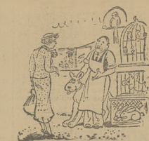
— Jeśli go pimi o berze, d d m ... nie złote rybki!