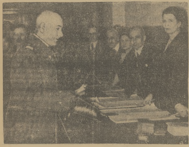
Naczelny Wódz Marszałek Śmigły-Rydz przy urnie wyborczej.