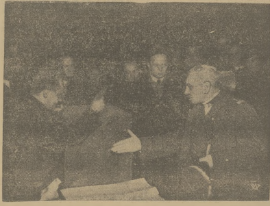
Moment głosowania premiera gen. Starojskiego Skłodowskiego.