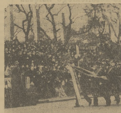
Górnicy polscy z Karlin w swych tradycyjnych strojach wraz z zastandem podczas wielkiej defilady w dniu 20-tych Niepodległości w Warszawie.