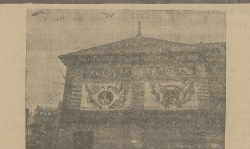
DAWNY ARSENAŁ STOLICY PO ODNOWIENIU

Anglijski są zachwyceni przedsięwzięciem mieszkańca białego namiotu. Dzięki temu ten pokójny jest w samym śródmieściu, bezpośrednim sąsiedztwie stacji kolejki podziemnej może locum dziennikarstwo położone jest niezwykle korzystnie, a ponadto bez większych kosztów korzystanie z tego bezpłatnego mieszkania, starcie się o niego nie oczywiście nie sądzą jakieś nieprzewidziane przeszkody — właścicielem parceli milionowej wprost wartości, gdyż jasnym jest, że wszelkie grunta w śródmieściu Londynu stoją wysoko w cenie, a wartość ich wciąż jeszcze wzrasta.