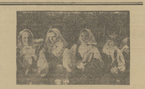
Górali z Jaworzyny witają wojska polskie chorągiewkami i barach narodowych.