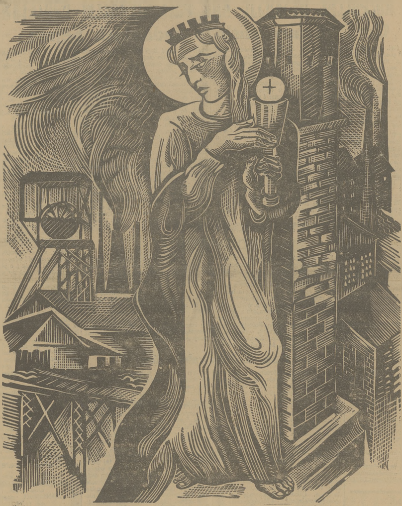
Rys. Bagna Kramodziejka-Gardosowa

NAD ZAGŁĘBIEM DZIS ANIOŁ ŁOPOCIE I BÓG SŁODKO SPOGLĄDA Z OBLOKÓW, — — — KTOŻ POLICZY TE DNI I TE NOCE, MIŁKIE MATEK I DZIAŁYWA NIEPOKÓJ?... GDY TE SZYKI MILCZĄCIE, NIEZBEROJNE BY RYCCERZE WYCHODZĄ NA WOJNĘ.