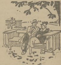
Zawód w parciu z centralnym ogrzewaniem