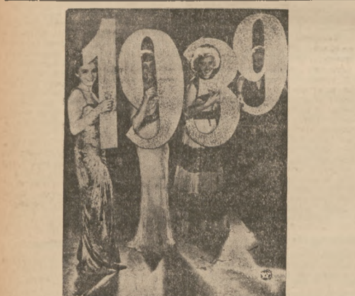
WIWAT NOWY 1939 ROK! Symboliczne powitanie 1939 roku na tradycyjnym balu sylwestrowym o godz. 12 w nocy.