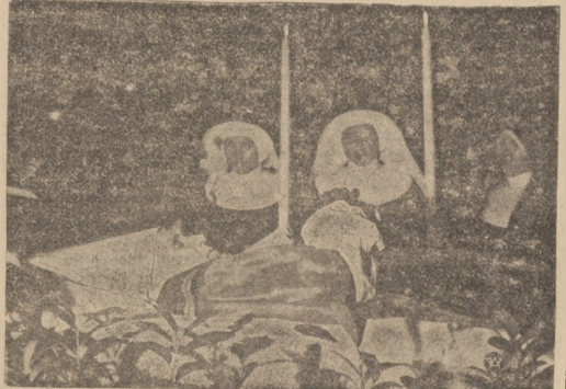
PO ZGONIE AP. KS. KARDYNAŁA ALEKSANDRA KAROWSKIEGO Na zdjęciu ap. ks. kardynał Aleksander Karowski na łóżku śmierci w pałacu Artybelskim w Warszawie.