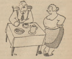
— Czy Pani, mała amerykańka, ta buteczka? — Tak, a kogo by to miał robić? — W takim razie chciałbym wiedzieć, jak potem miało zabrać.

bezpieczeństwa, jak już to tym donosił. śmy, zarządziły energiczną akcję, mającą na celu zlikwidowanie elementu przestępczego na wzornym całym terenie.