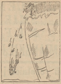
— Panna ziołodzię, kto zapłaci rachunek?