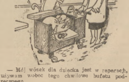
— Mój wózek dla dziecka jest w reparacji, używam wobec tego chwilkowo bufała podobnego.

Ekspozytura Wojewódzkiego Biura Funduszu Pracy w Sosnowcu podaje do wiadomości, że kontrolę bezrobotnych pracowników fizycznych, pobierających zasiłki ustawowe z Funduszu Pracy przeprowadza będąca od 15 do odwołania po bydani w trybie od litery A—K włącznie i w czwartki od 12, do godziny 8.30 do 13.00 dla mężczyz i od 13 do 15 dla kobiet.