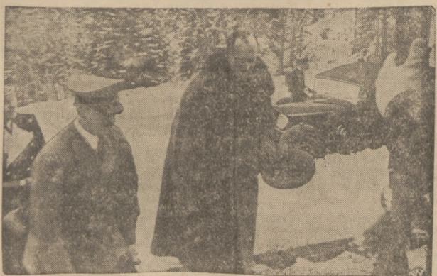
MINISTER BECK U KANCLERZA HITLERA

Po krótkiej rozmowie z Nuncjuszem Apostolskim, Pan Prezydent Rzeczypospolitej powrócił do swoich apartamentów.