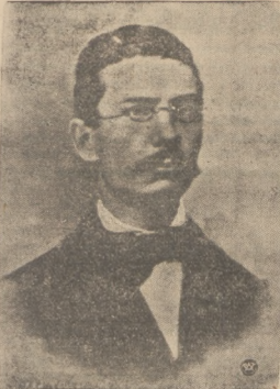
Władz Powstańca styczniowego i szef Rady Narodowej, dyktator Romuald Traugott...

— „Rok 1863 dał wielkość nieznaną, wielkość, co do której — teraz świat wątpi, gdy mówi o nas — wielkość, za którą przetrwał wszystkim teni, co my o sobie mówimy, wielkość cudu pracy ogromu siły zbrojowej, siły zbrojowej wysiłków woli, sądy moralnej”.