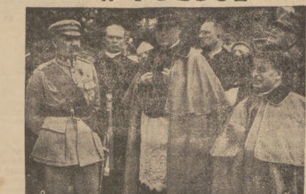
Marszałek Piłsudski w towarzystwie Nuncjusza Rattiego — Papieża Piusa XI.

Papież Benedykt XV, ocenając wielkie zdolności dyplomatyczne ks. Rattiego, wybrał go 30 maja 1918 r. w misji dyplomatycznej do Polski, jako wysłannika Apostolskiego. W roku (1918) Ratti został Nuncjuszem Apostolskim w Polsce i tytułującym arcybiskupem Lepantu.